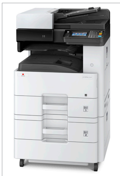
d-Copia 255MF con pedestal PF-470 con 1 cassette adicional