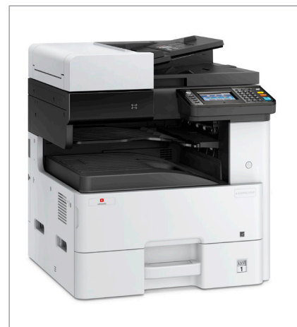
d-Copia 255MF configuración básica